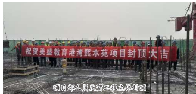
项目管理人员庆祝工程主体封顶

保证资料，建筑原材料、构配件进行进场检验，严格执行见证取样制度，且所有检验报告、合格证均反映原材料、构配件为合格产品，检验批全部合格。在安全管理方面，严格执行《建筑施工安全检查标准》，坚持“安全第一、预防为主”管理方针，加强对项目安全生产的安全领导，建立以项目经理为首的施工安全生产管理体系，对工人先培训再上岗，做好三级安全教育培训，特殊作业人员持证上岗，严格落实安全技术措施交底制度，加强各项安全检查。工程在“豫建杯”2023年度河南省智慧化管理推选中，被评为智慧化管理示范项目。随着主体封顶，下阶段将进行二次结构和装饰装修施工。项目部继续贯彻“以用户为中心”的理念，根据建设单位工期计划，一如既往按照高标准高质量的要求施工，向客户交出满意答卷。（郑州分公司 文/图）