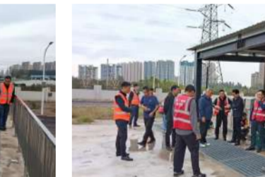
竣工验收，查验质量