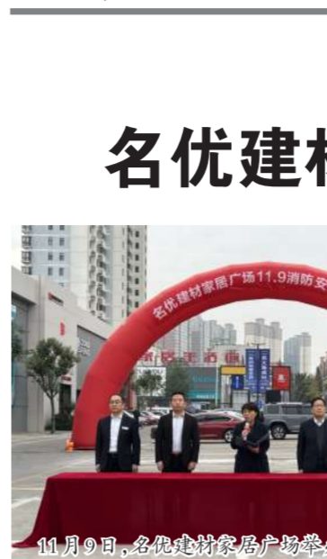
11月9日，名优建材家居广场举办消防安全演练